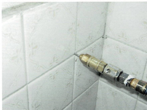
▲浴室壁面薬剤注入