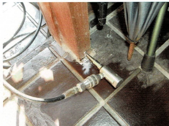
▲玄関ドア枠薬剤注入